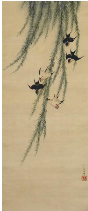
葛飾北斎「柳に燕図」(前期)