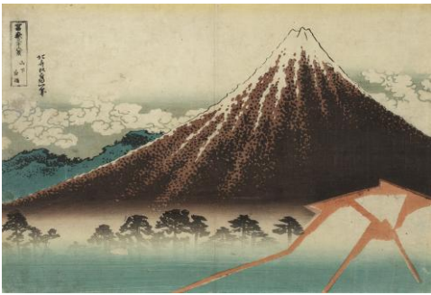
葛飾北斎「富嶽三十六景 山下白雨」(変わり図) (後期)