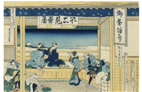
葛飾北斎「富嶽三十六景 東海道吉田」(通期) ※1