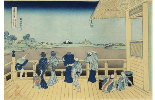
葛飾北斎「富嶽三十六景 五百らかん寺さゝみどう」(通期) ※1