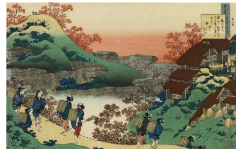
葛飾北斎「百人一首乳母かゑとき 猿丸太夫」(通期) ※1