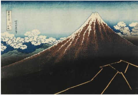
葛飾北斎「富嶽三十六景 山下白雨」(通期) ※1