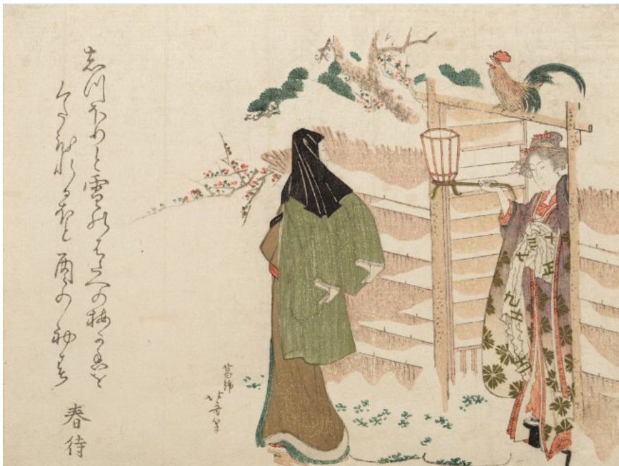
葛飾北斎「雪の朝」 すみだ北斎美術館蔵（通期）※半期で同タイトルの作品に展示替え