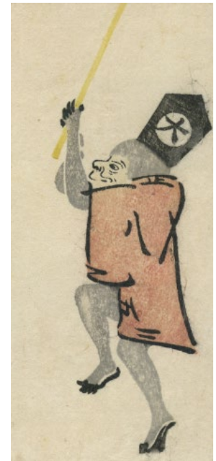
絵師未詳「猿」 すみだ北斎美術館蔵（後期）