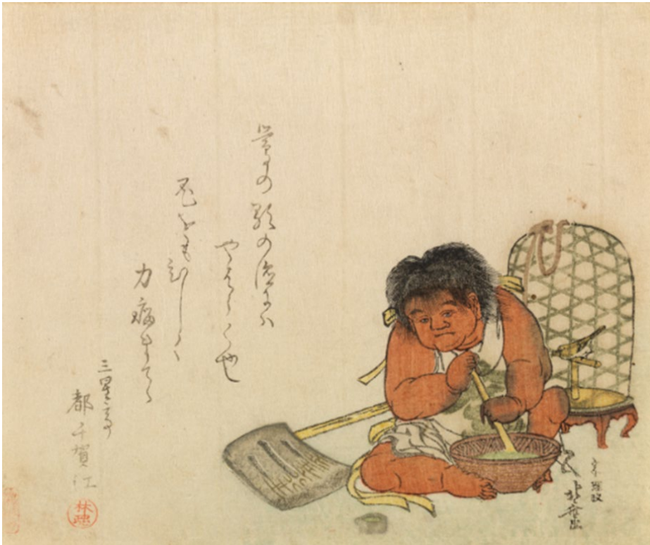
葛飾北斎「鶯と金太郎」 すみだ北斎美術館蔵（前期）

絵曆中にある “数字”を見つけください！ 左の作品は、葛飾北斎「鶯と金太郎」という作品ですが、よくみると金太郎の横に置かれている斧には“小”という文字と、刃先に「正、五、六、八、十、十一」の文字が！ 1,5,6,8,10,11の小の月は、寛政11年。この年に配ったものということがわかります。