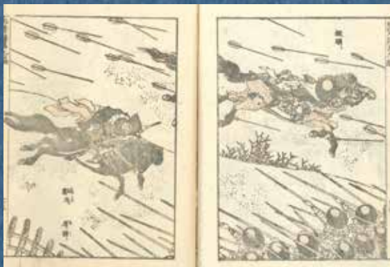
葛飾北斎『北斎漫画』九編