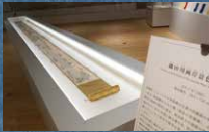
「隅田川両岸景色図巻」(複製画)展示の様子

2023年12月14日(木)~2024年2月25日(日) 北斎が描く武者絵を中心に、武士の時代にせまる特別展を開催予定