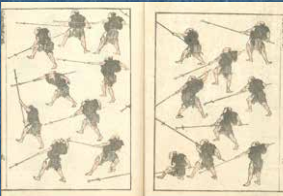
葛飾北斎『北斎漫画』六編