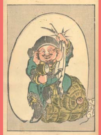
すべて葛飾北斎画、すみだ北斎美術館蔵 ※各作品の展示期間はホームページをご確認ください。本展出品作品には、現在では使用が認められない不適切な表現が含まれておりますが、絵師の作画意図をよりよく理解するため、原資料のまま展示・掲載しております。