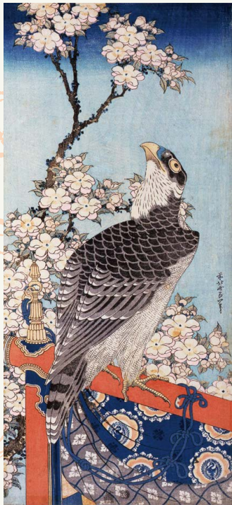
春 葛飾北斎「桜に鷹」(後期)