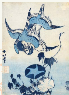
夏 葛飾北斎「朝顔に雀」(前期)