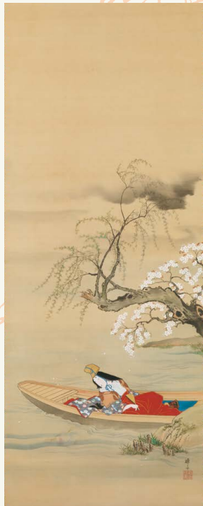
春 蹄齋北馬「朝妻舟」(前期)