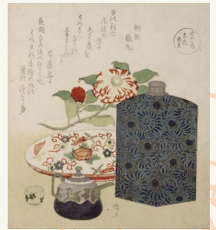
冬 柳々居辰斎「五色之内 赤絵南京」(後期)