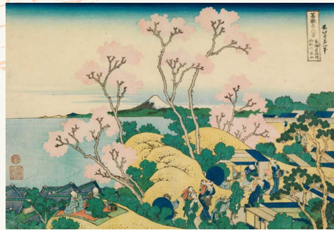
春 葛飾北斎「富嶽三十六景 東海道品川御殿山ノ不二」(前期)