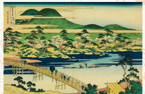
春 葛飾北斎「諸国名橋奇覧 山城あらし山吐月橋」(後期)