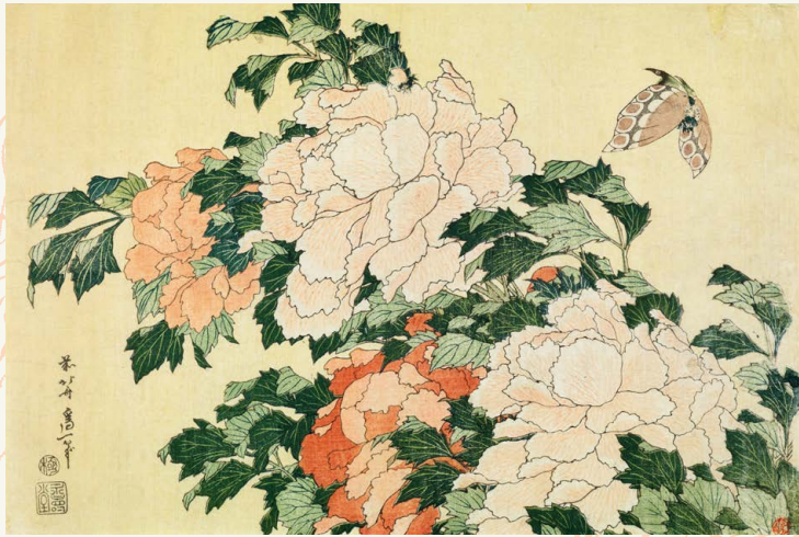
春 葛飾北斎「牡丹に胡蝶」(前期) ※表面の作品画像は展覧会のビジュアル用に調整されています。