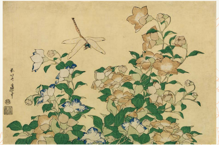
秋 葛飾北斎「桔梗にとんぼ」(後期)