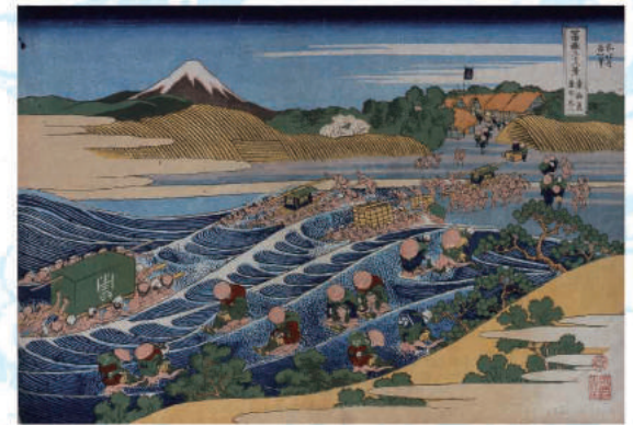
「富嶽三十六景 東海道金谷ノ不二」(後期)