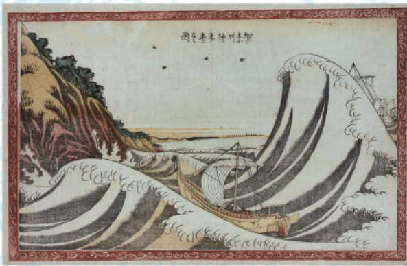
「賀奈川沖本空之図」(前期)