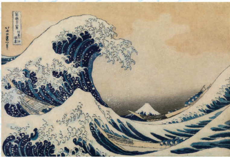
「富嶽三十六景 神奈川沖浪裏」(前期) ※後期は掲載とは異なる作品を展示