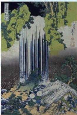
「諸国瀧廻り 美濃ノ国養老の滝」(後期)