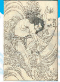
「忠義水滸伝画本」 「浪裡白跳 張順」(通期)

鑑賞ポイント 表面に使用したビジュアルは「忠義水滸伝画本」浪裡白跳 張順」という作品で、その水しぶきの描き方には「富嶽三十六景 神奈川沖浪裏」の波の表現の芽生えがみられます。この作品の他にも北斎の多彩な水の表現をぜひお楽しみください。