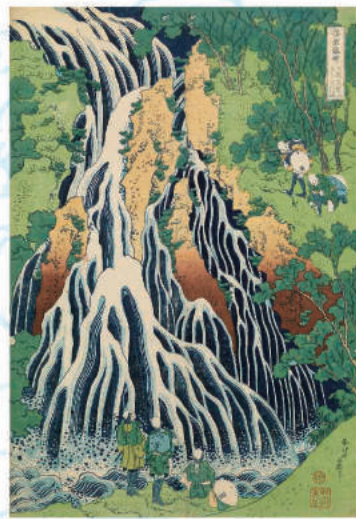
「諸国瀧廻り 下野黒髪山きりふりの滝」(後期)

鑑賞ポイント 表面に使用したビジュアルは「忠義水滸伝画本」浪裡白跳 張順」という作品で、その水しぶきの描き方には「富嶽三十六景 神奈川沖浪裏」の波の表現の芽生えがみられます。この作品の他にも北斎の多彩な水の表現をぜひお楽しみください。