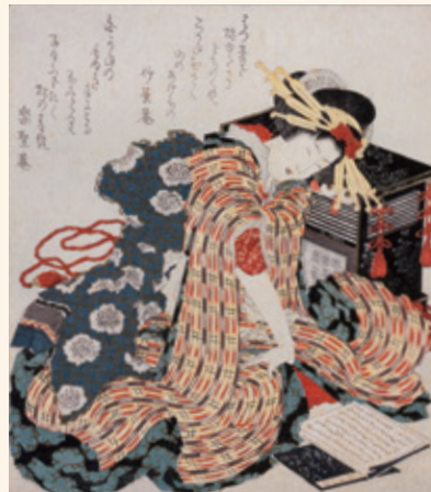
葛飾北斎「枕草子を読む娘」(前期)