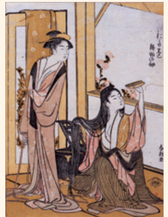
葛飾北斎「俳諧おた巻 植物の部」(前期)