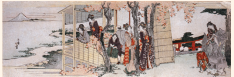
葛飾北斎「神田明神休茶屋」(前期)