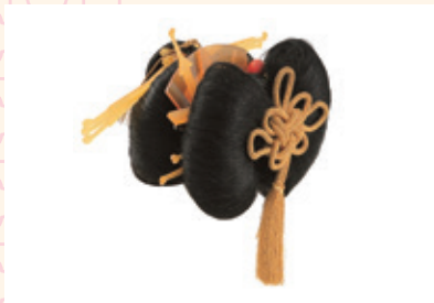
横兵庫/ポーラ文化研究所蔵