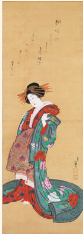
葛飾北斎「花魁図」(後期)