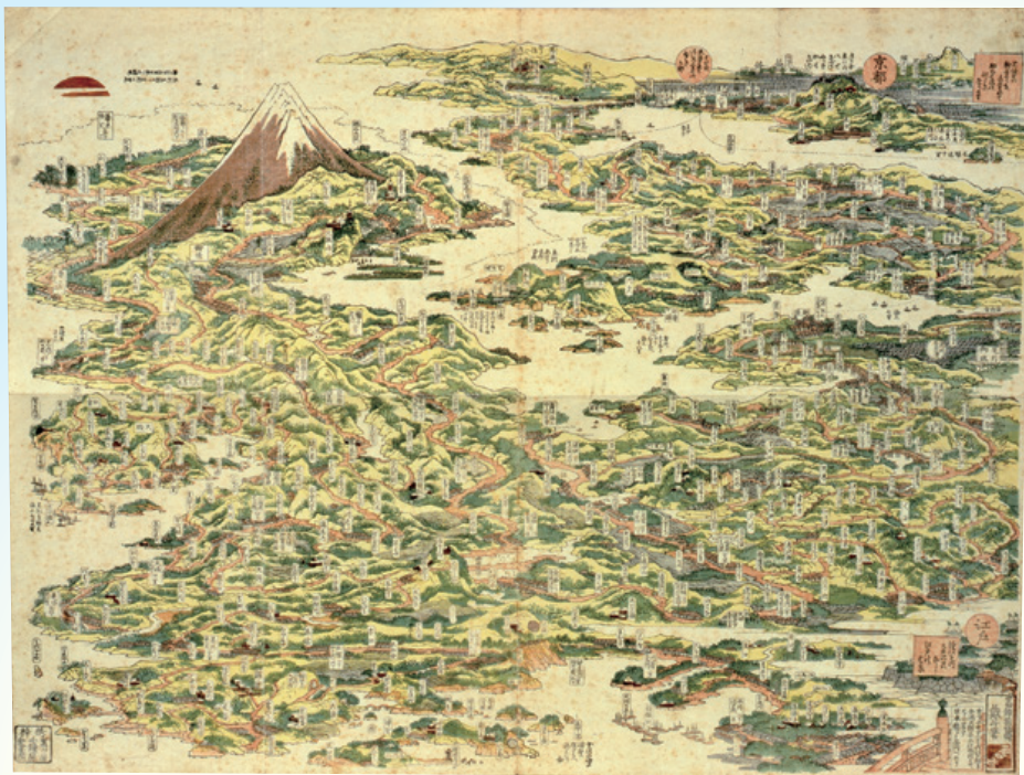
「東海道名所一覽」(前期展示:当館所蔵) ※後期には国立歴史民俗博物館所蔵作品を展示