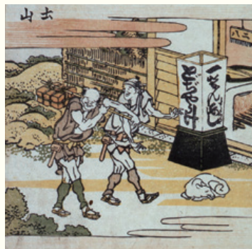
「東海道五十三次絵巻 土山」(前期展示)