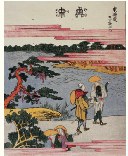
「東海道五十三次 絵本駅路鈴 奥津」(後期展示)

「東海道五十三次」といえば、歌川広重が有名です。しかし!広重からさかのぼること約30年。北斎も「東海道五十三次」シリーズを手掛けているのです。その数は、当時の絵師の中では群を抜いており、その人気のほどをうかがい知ることができます。広重の「東海道五十三次」は風景を描いたものが多いですが、北斎はその土地の風俗を描いたものが多く、小さくて、手にとってじっくり眺めたいようなかわいらしいものばかりです。行楽シーズン、北斎とともに「東海道五十三次」の旅におでかけ下さい。