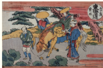
「五十三次江都の往かい 袋井」(後期展示)