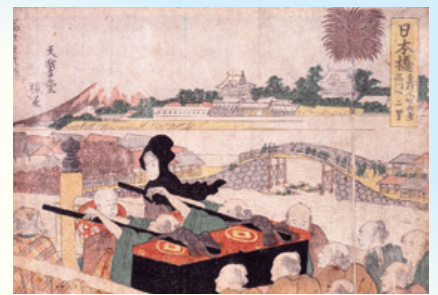
「春興五十三駄之内 日本橋」(前期展示)