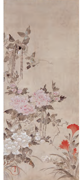
深江蘆舟「花卉図」(後期展示)