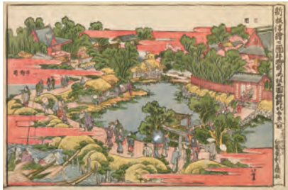
「新板浮絵三囲牛御前両社之図」(前期展示)