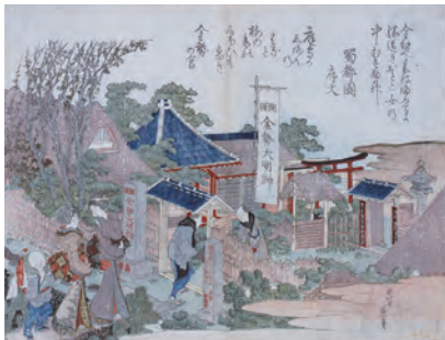
「寺島法泉寺詣」(後期展示)