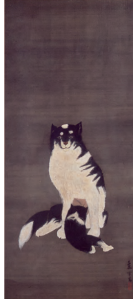
長澤蘆雪「洋風母子犬図」(前期展示)