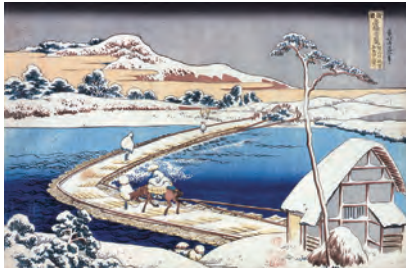
「諸国名橋奇覧 かうつけ佐野ふなはしの古づ」(後期展示)