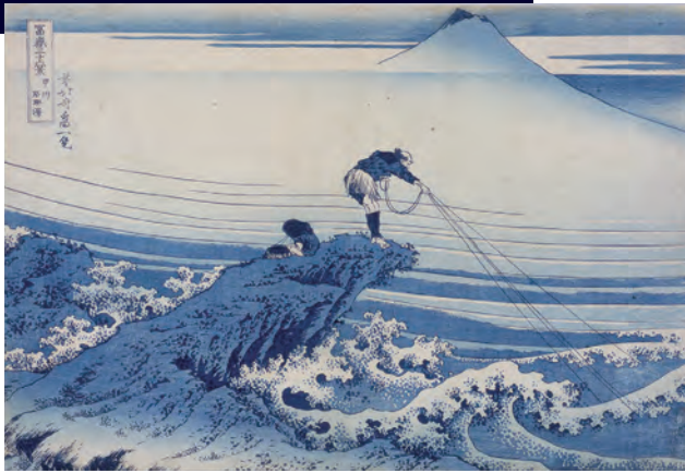
「富士三十六景 甲州石班沢」(前期展示)