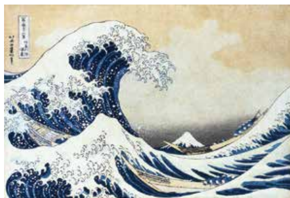
「富嶽三十六景 神奈川沖浪裏」 ※12/13 ~ 25 展示予定