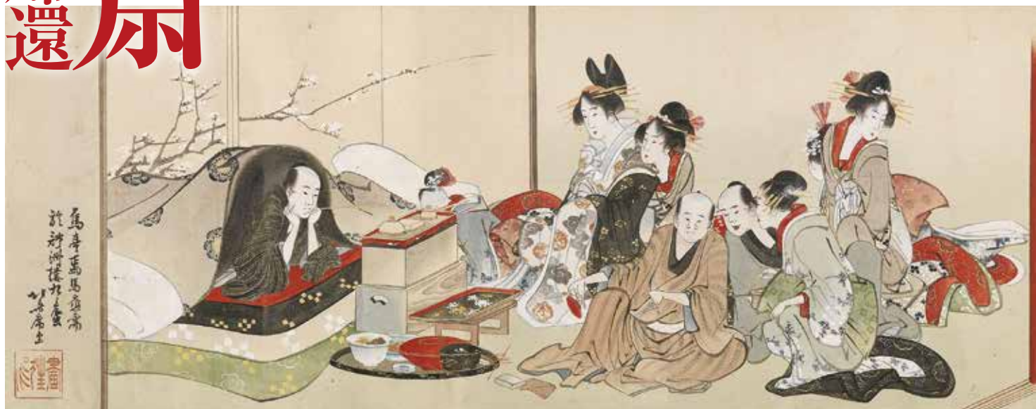
「偶田川両岸景色図巻」(紙本着色1巻)