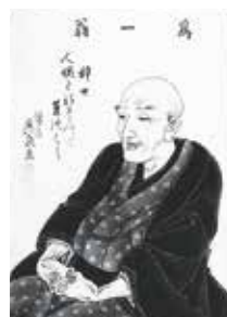
葛飾北斎肖像画(淡斎英泉画)

世界的な芸術家として評価の高い葛飾北斎(1760-1849)は、本所割下水(現在の北斎通り)付近で生まれ、およそ90年の生涯のほとんどを区内で過ごしなが、優れた作品を数多く残しました。その生誕の地に北斎の美術館が開館します。これはまさに北斎の里帰り、帰還です。