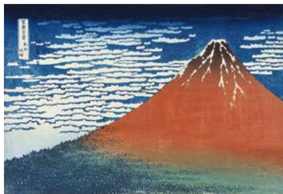
「富嶽三十六景 凱風快晴」 ※1/2 ~ 1/15 展示予定