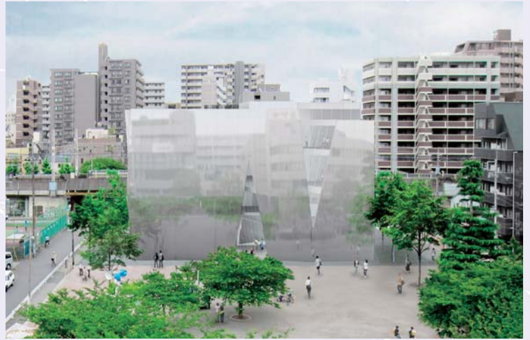
「すみだ北斎美術館」の外観イメージ