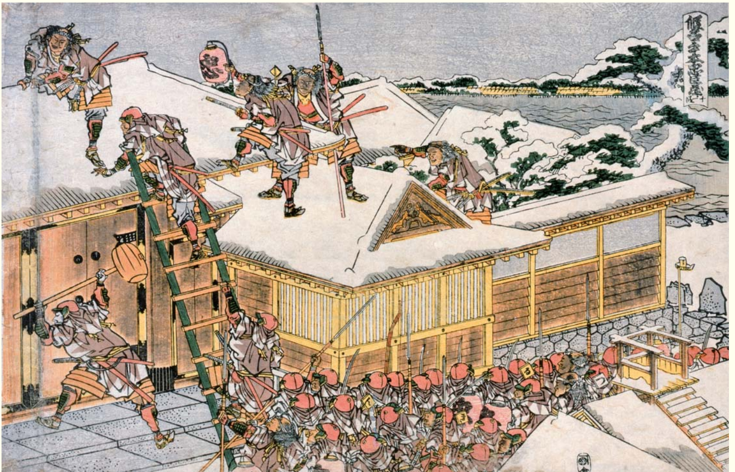
「仮名手本忠臣蔵 十一段目」(大判錦絵) 文化3 (1806) 年頃