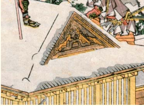
《図一》白抜きで表現した雪