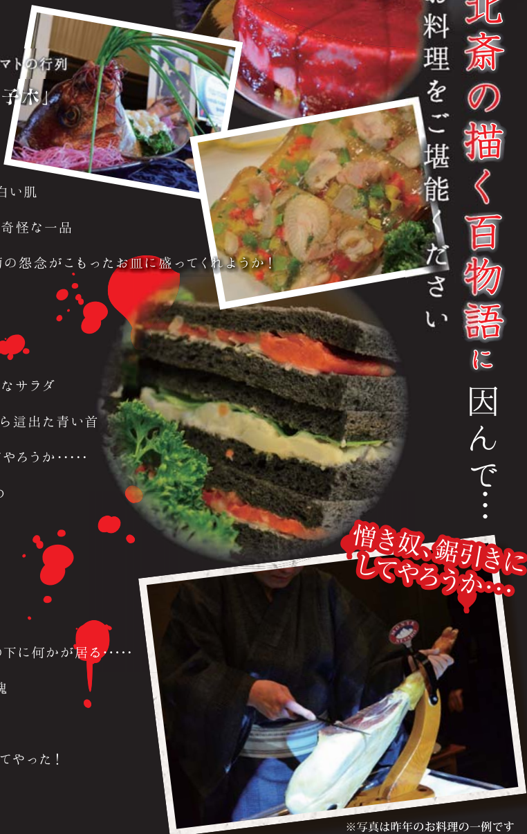
※写真は昨年のお料理の一例です