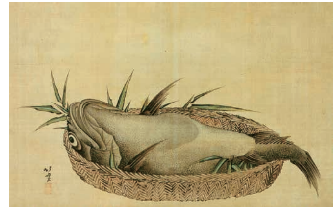
葛飾北斎「鯉鱈図」(前期)

本展では、浮世絵だけではなく、江戸時代の料理を再現したレプリカや当時のレシピ本などもまじえ、現在の食文化のルーツである江戸時代の食の在り方をご紹介します。大江戸グルメを心ゆくまで堪能ください。